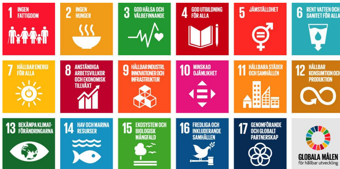
Bild 1. 17 globala mål för hållbar utveckling