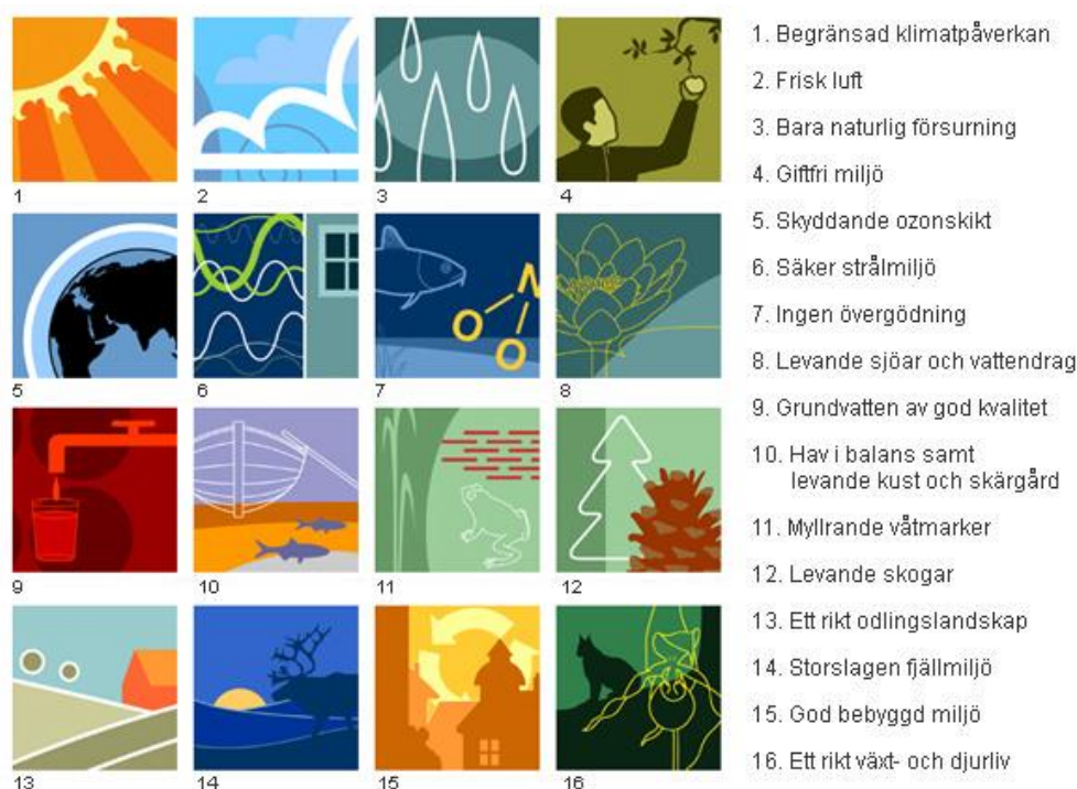
Bild 2. Sveriges 16 miljö kvalitetsmål

Arbetsprocessen kring miljö kvalitetsmålen är väl utarbetad. Det finns mätbara mål, etappmål, indikatorer, ansvariga myndigheter och en löpande uppföljningsprocess. Miljö målen har hittills följts upp mot år 2020. Nästa hållpunkt blir år 2030 som sammanfaller med året för de globala hållbarhetsmålen i Agenda 2030.